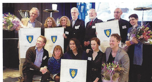
Alla glada pristagare av St Julianpriset.